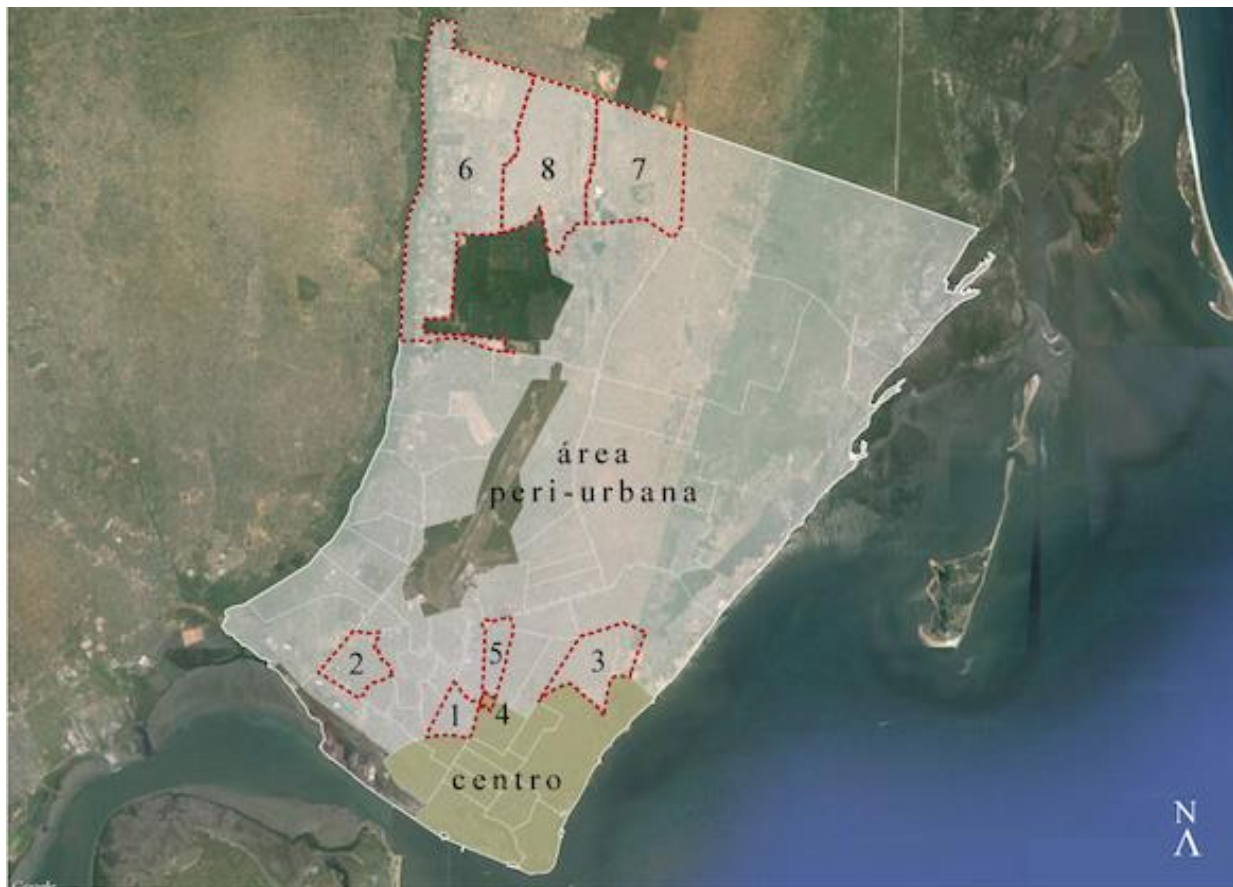
Bairros de Maputo. 1. Mafalala | 2. Chamanculo C | 3. Polana Caniço A | 4. Área da Praça de Touros | 5. Maxaquene A | 6. Zimpeto | 7. Magoanine B | 8. Magoanine C